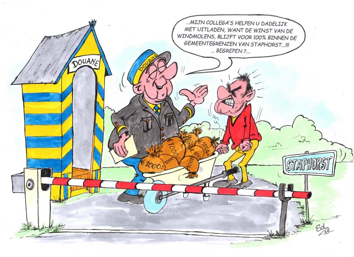
Ed Perdok - Wij Duurzaam Staphorst

50% lokaal eigendom is een streven; in het proces wordt bepaald hoeveel het aandeel eigendom van de lokale omgeving wordt. Minder kan, maar maximaal kan ook: 100% lokaal eigendom, bijvoorbeeld in een samenwerking tussen energiecoöperatie en lokale grondeigenaren.